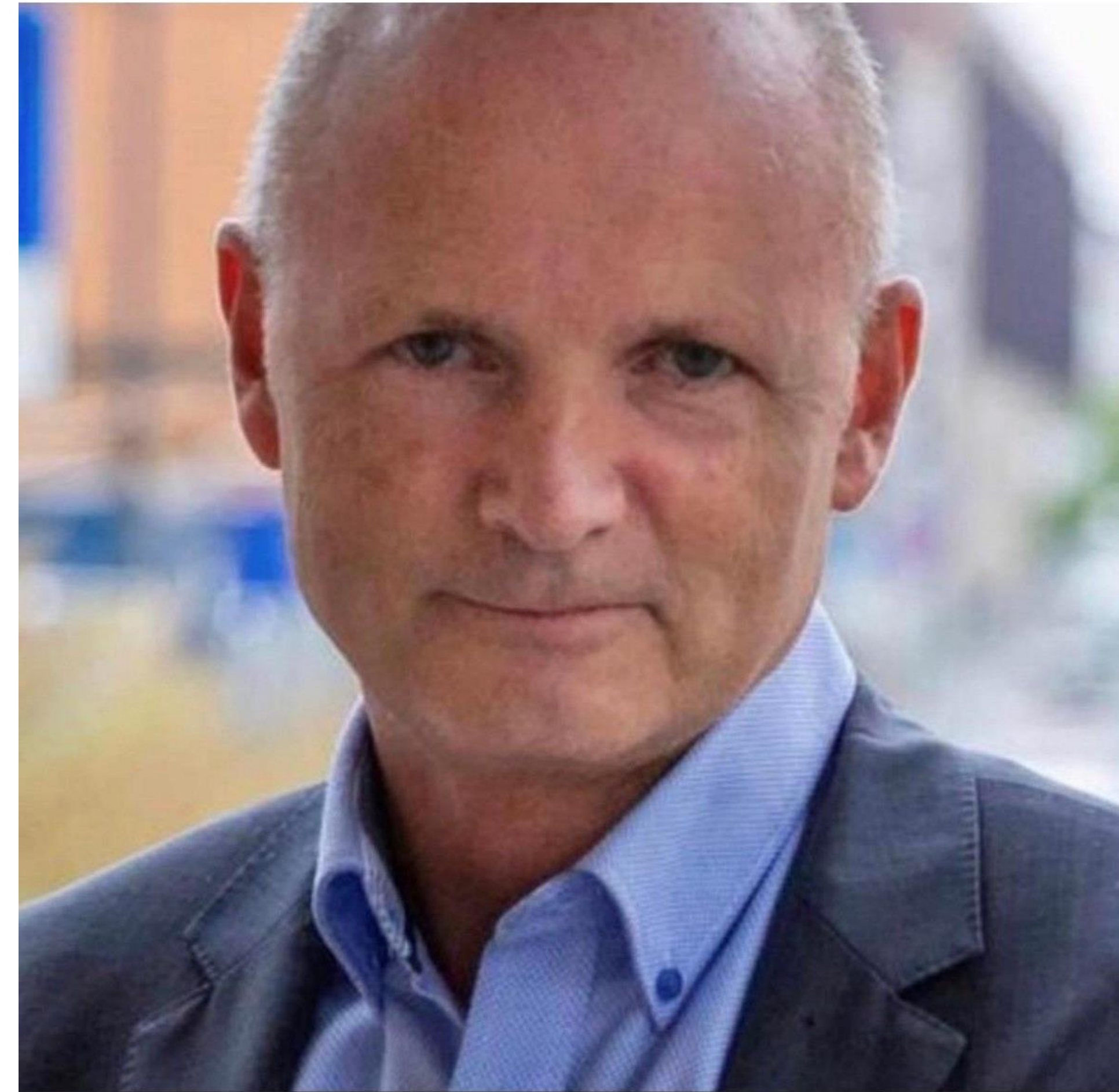
Varaordfører i Moss mener det er på tide å heve kvaliteten på valggjennomføringen.